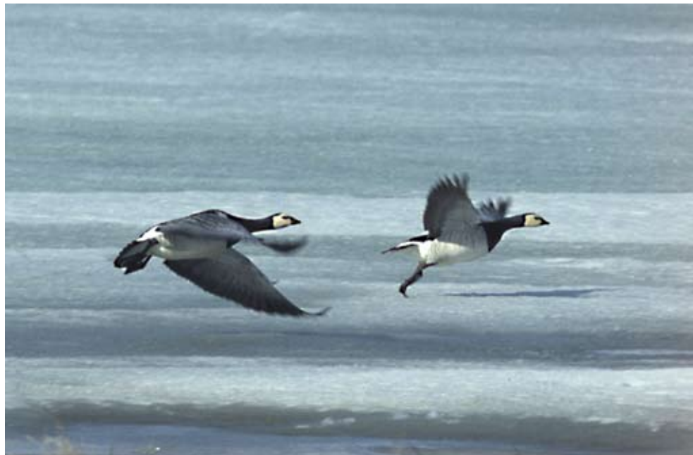
Bild 2: Kommen die Gänse im Brutgebiet an, beherrschen dort noch Eis und Schnee das Bild. (Nonnengänse auf Kolguev Juni 2007)

so dass sie für knapp 20 Tage flugunfähig sind. Umso mehr suchen sie den Schutz der zahlreichen Seen oder der Meeresküste, sind hochgradig scheu und meiden auch den Menschen weiträumig. Wenn Mitte August die Vögel wieder fliegen können, ist auch das Gefieder der Jungvögel vollständig ausgebildet, und die Gänsefamilien sind für ihre lange Reise in die Tausende von Kilometern entfernten Überwinterungsgebiete gerüstet. Jetzt endet für sie die Attraktivität des Nordens. Bald drohen die ersten Fröste und Schneefälle.