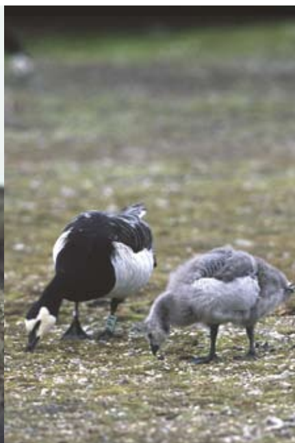
Bild 4: In der Arktis wachsen die Gänseküken schnell heran (Nonnengänse auf Svalbard, Ny Alesund 2000)