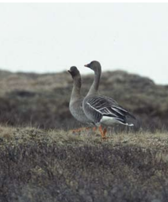
Bild 3: Nach wenigen Tagen beginnen die Gänse in ihren angestammten Revieren mit der Eiablage (Saatgänse auf Kolguev Juni 2007)